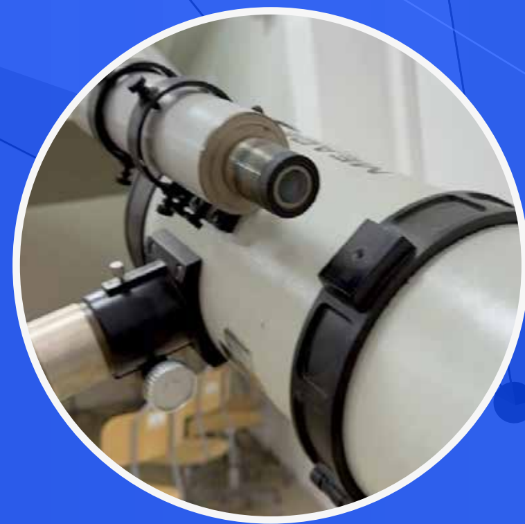
L'OFFICINA DEL PLANETARIO