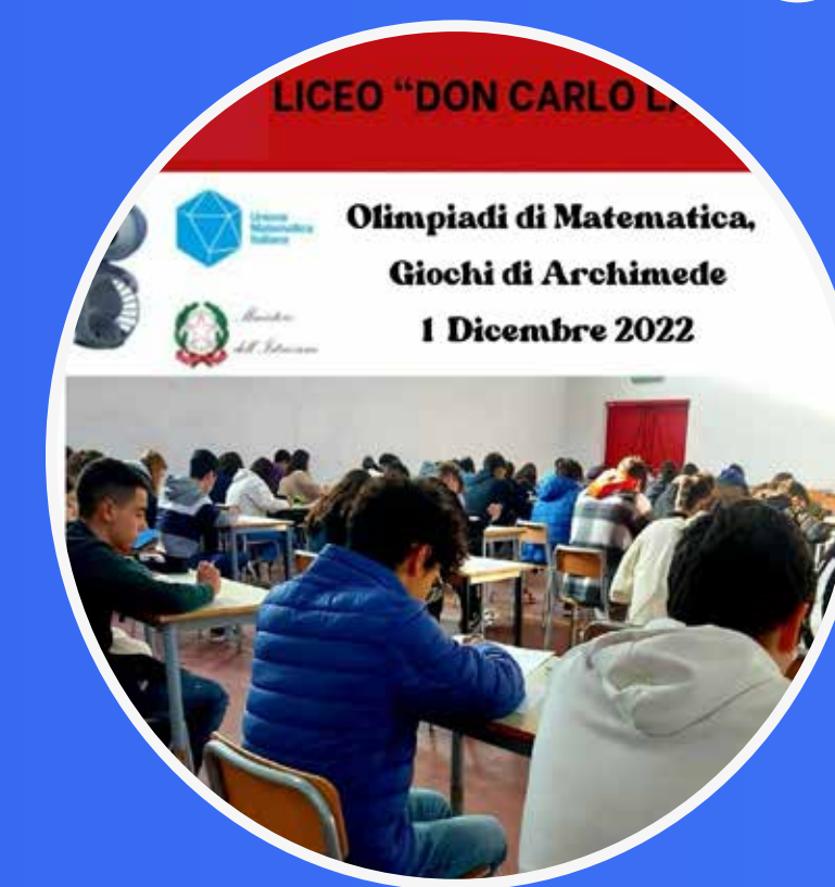
OLIMPIADI DI MATEMATICA