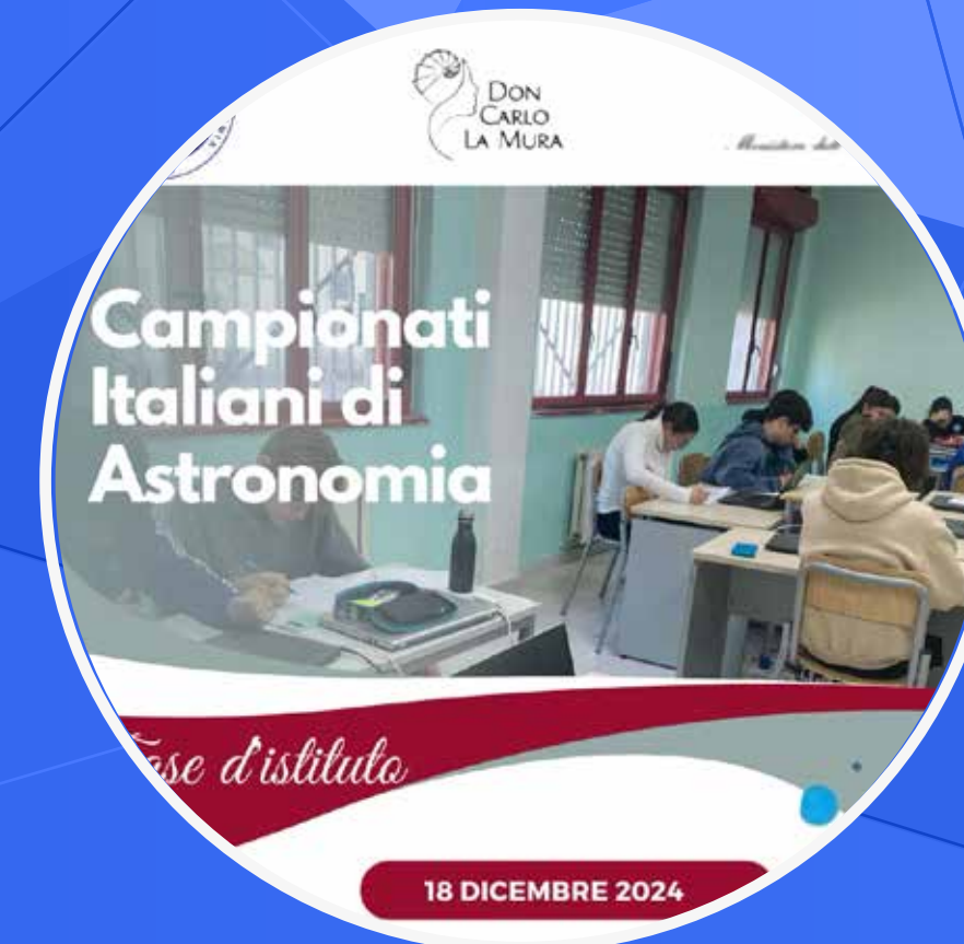
CAMPIONATO DI ASTRONOMIA