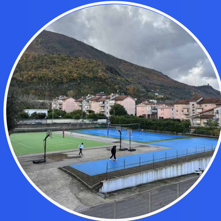
STRUTTURA POLIVALENTE ESTERNA