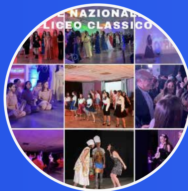
NOTTE NAZIONALE DEL LICEO CLASSICO