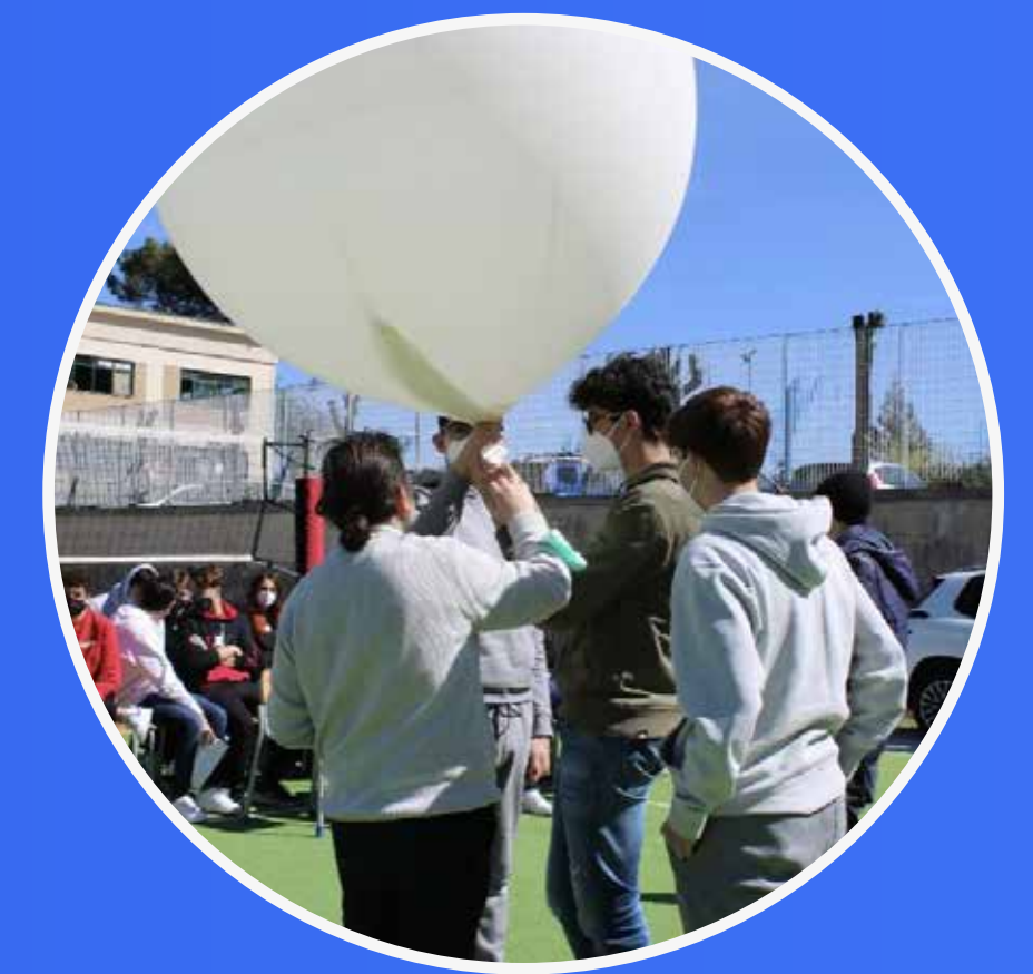
STAZIONE METEOROLOGICA INTELLIGENTE