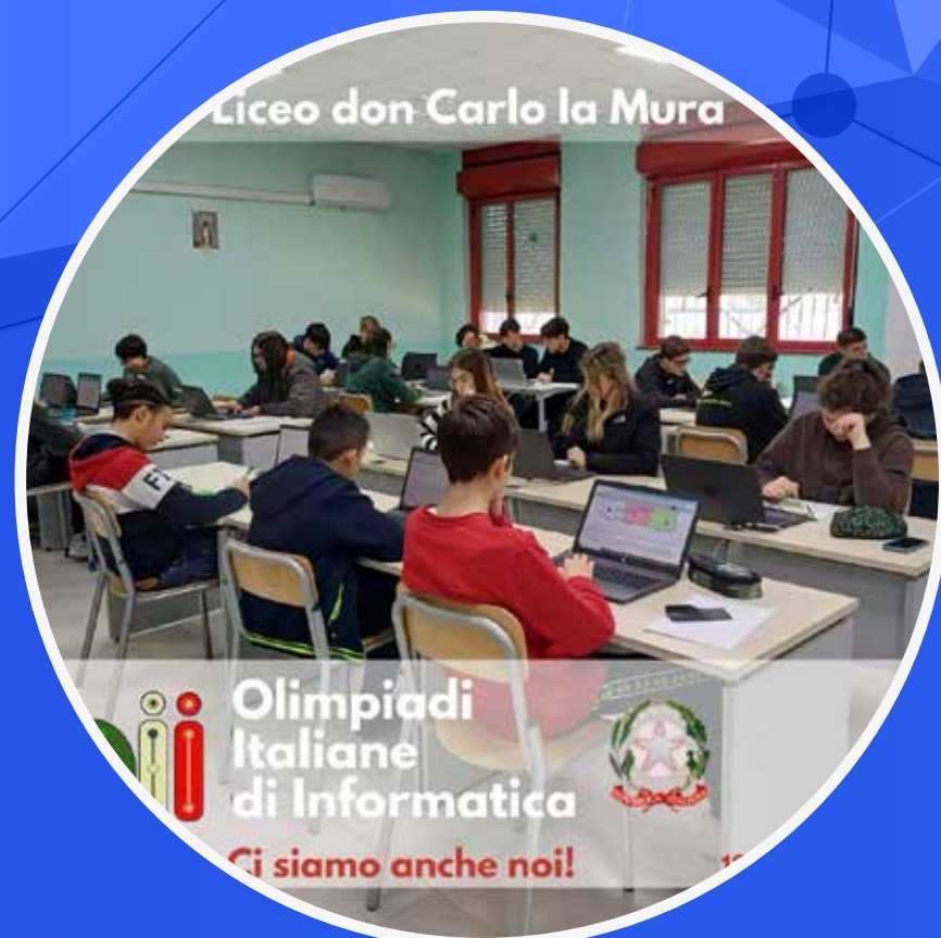
OLIMPIADI DI INFORMATICA