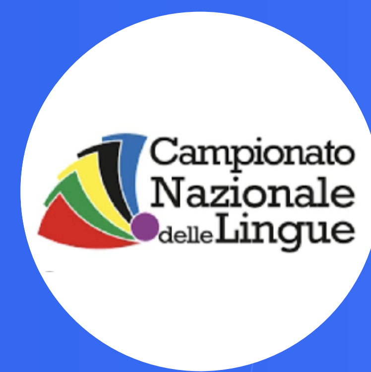
CAMPIONATI DI LINGUE