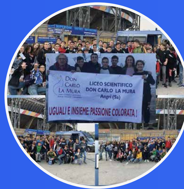
SCUOLE ALLO STADIO