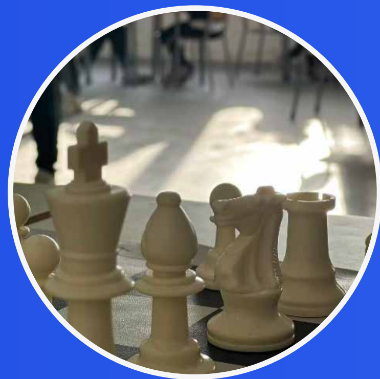
CAMPIONATI DI SCACCHI