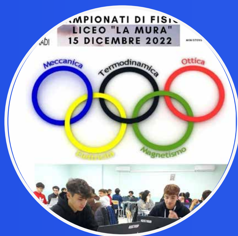
CAMPIONATI DI FISICA