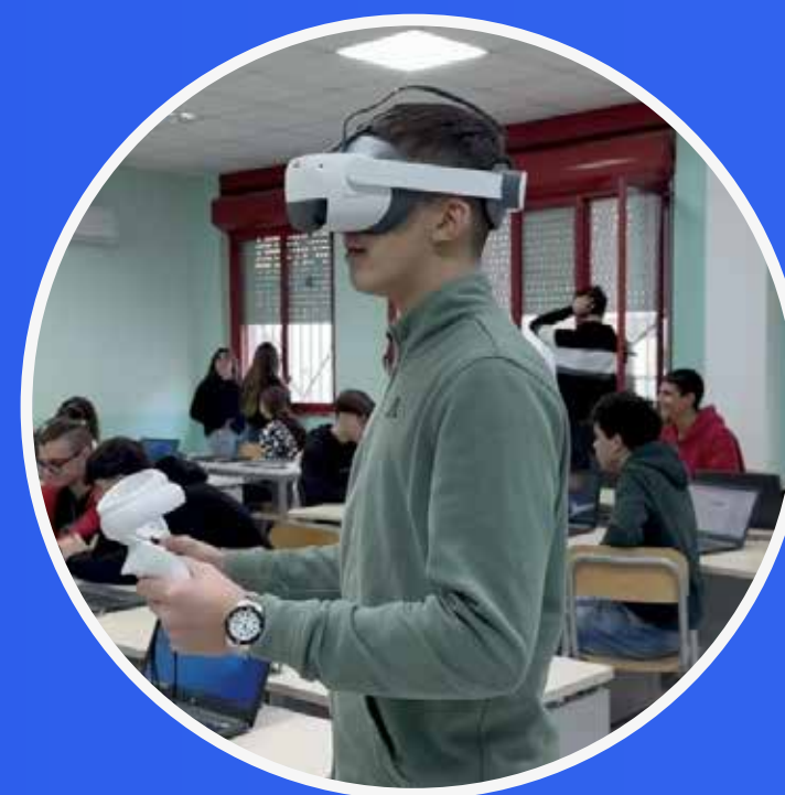
LABORATORIO LEARN IN VR