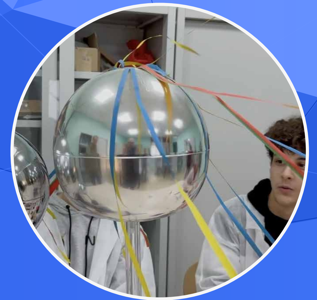
LABORATORIO DI FISICA