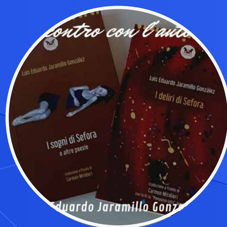
INCONTRO CON AUTORI STRANIERI