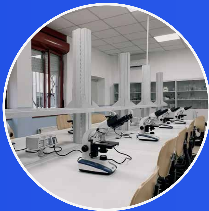
LABORATORIO DI SCIENZE