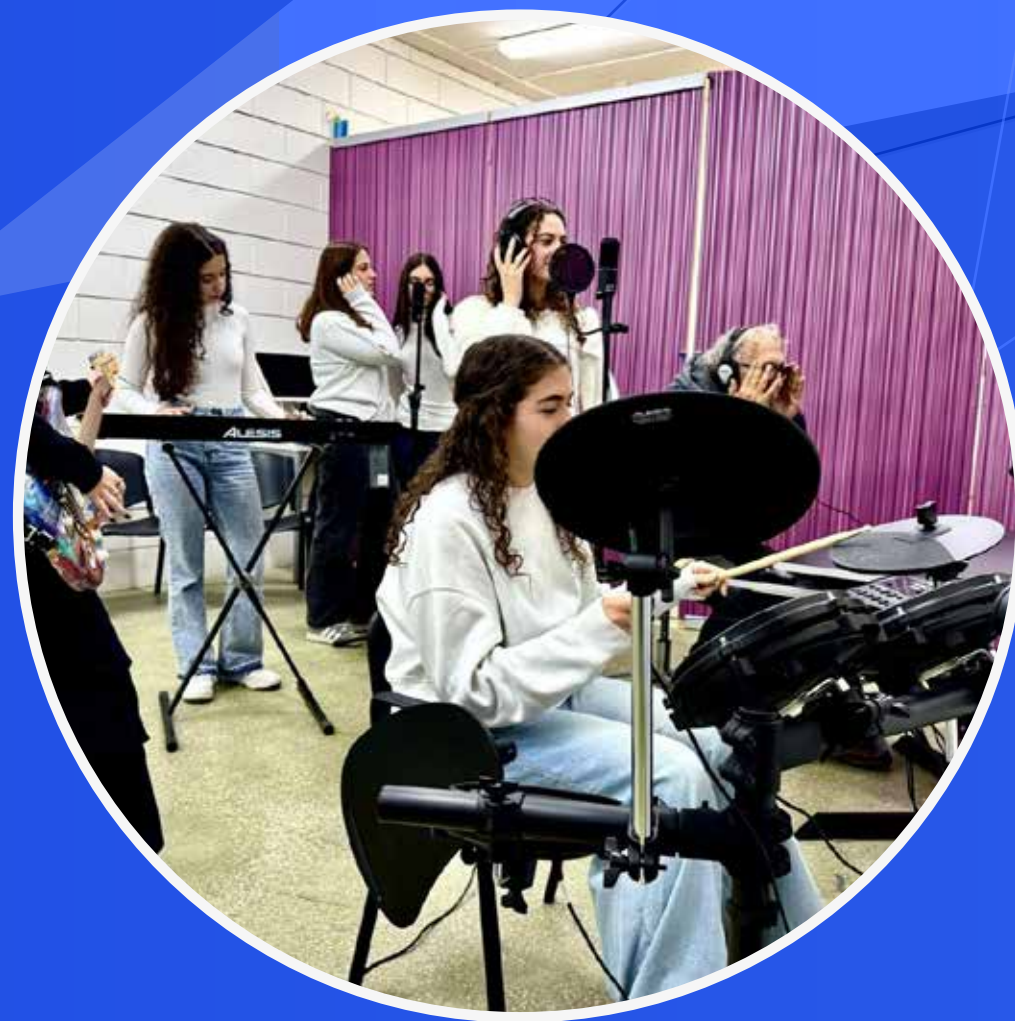
CAMPUS WEBRADIO E WEBTV