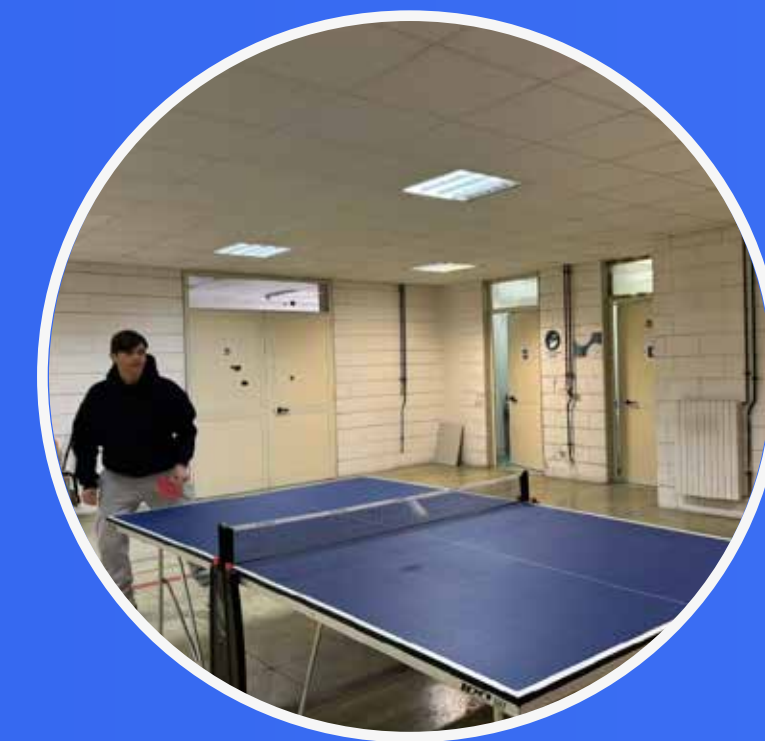
CAMPIONATI DI PING PONG