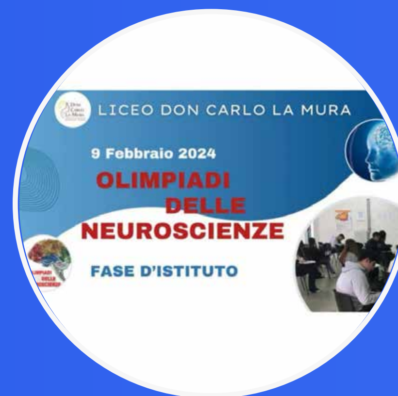
OLIMPIADI DI NEUROSCIENZE