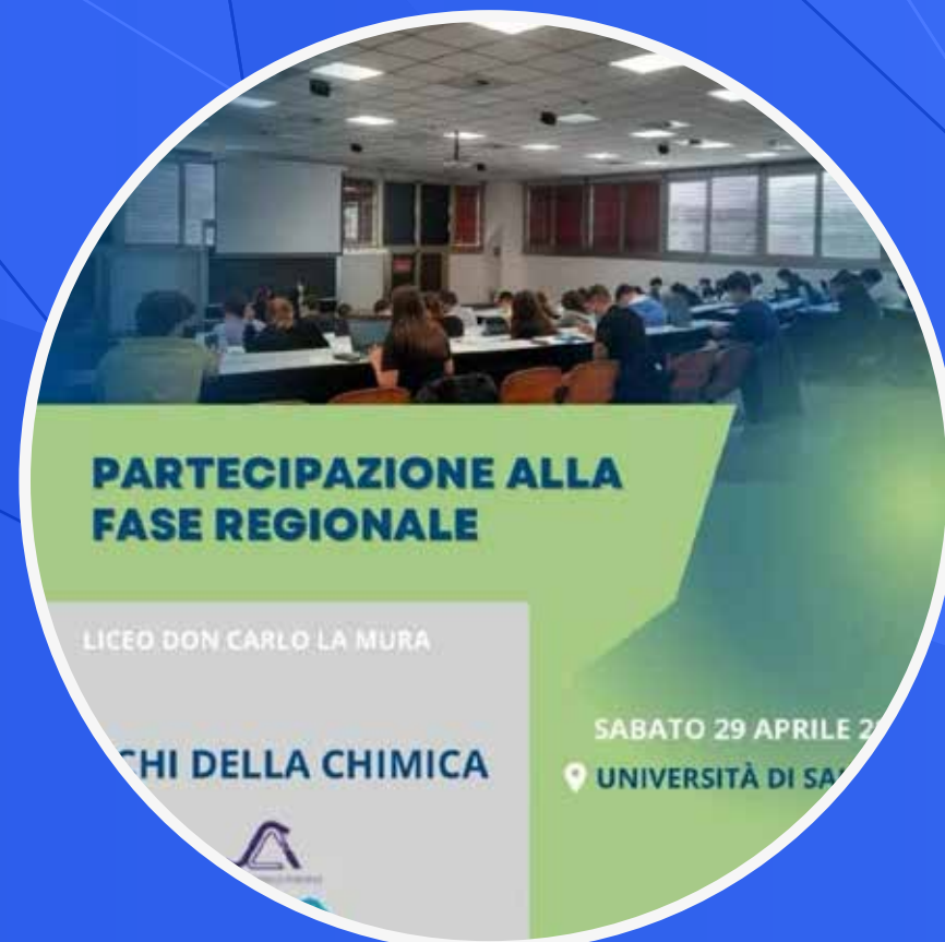
GIOCHI DELLA CHIMICA