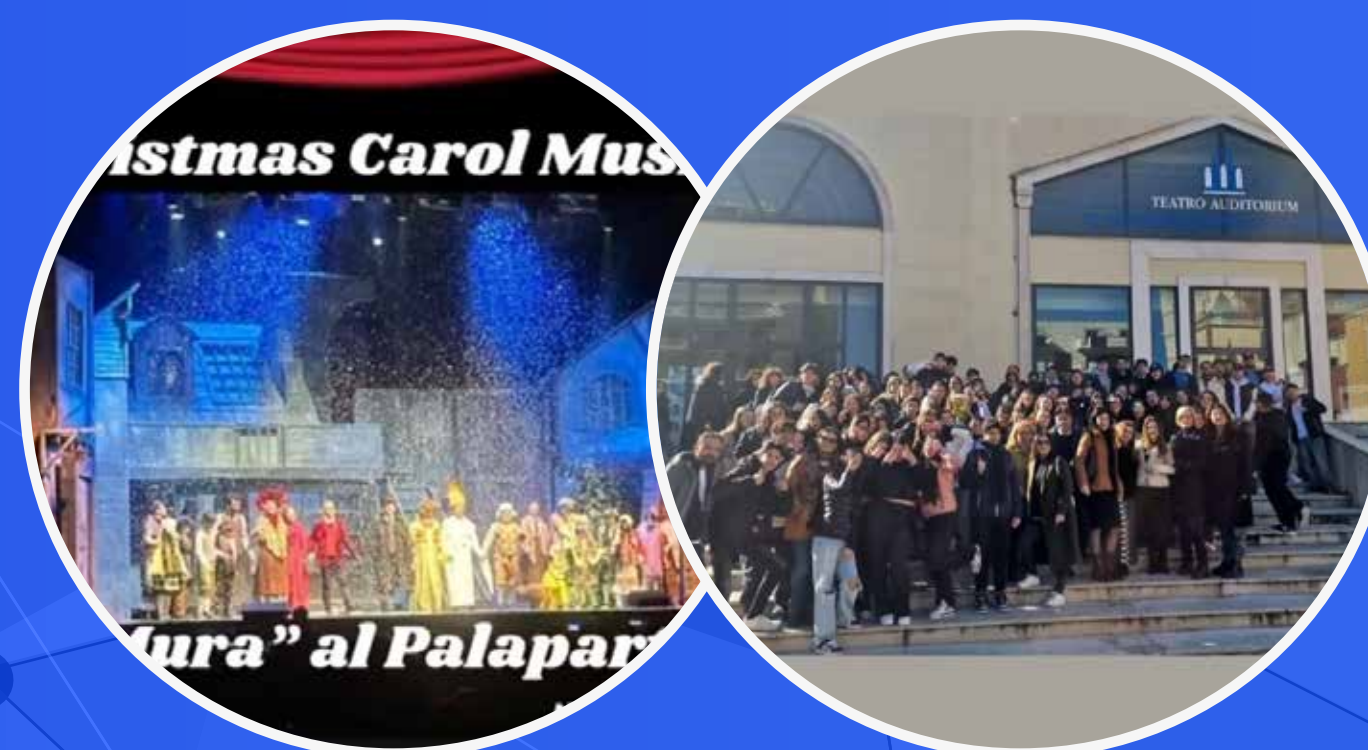
SPETTACOLI TEATRALI IN LINGUA