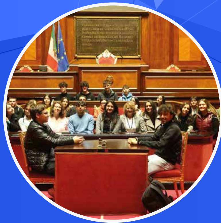
UN GIORNO IN SENATO